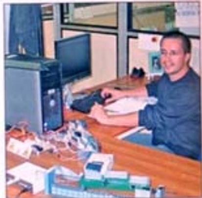
Un bureau d'études dynamique

Spécialisée dans la conception, l'industrialisation et la commercialisation de composants et de cartes électroniques pour les marchés du lavage et de la cuisson (programmeurs électromécaniques et électroniques, cartes d'interface utilisateurs, sélecteurs et potentiomètres, sondes de température), Noalia Solutions dispose également de deux autres sites proches d'Asti et de Milan pour être plus proche de sa clientèle en majorité italienne, tandis que la production est réalisée en Tunisie. Véritable partenaire industriel et fournisseur de solutions, l'entreprise appuie son développement sur un bureau d'études performant et une équipe réactive, qui répond aux défis des clients et commercialise de nombreux produits nouveaux, sous les marques Crouzet et Noalia. Avec